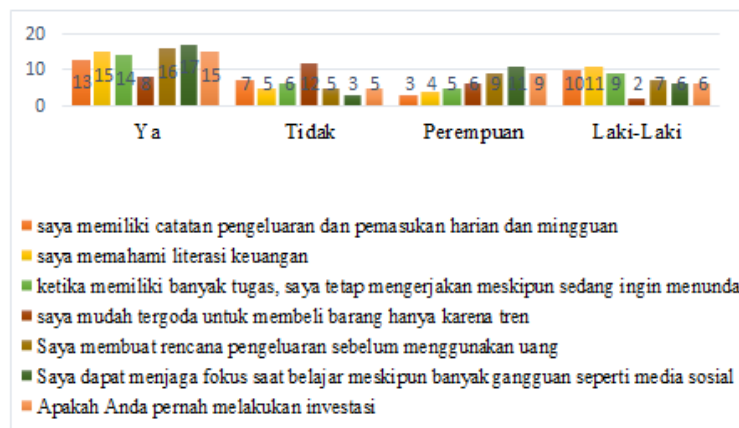
Gambar 1. Hasil Observasi.

Dari data dilapangan membuktikan jika mahasiswa akuntansi memiliki perilaku pengelolaan keuangan yang cukup baik. Ini ditunjukkan oleh fakta bahwa sebagian besar siswa mencatat pemasukan dan pengeluaran, memiliki pemahaman yang baik tentang keuangan, dan membuat rencana pengeluaran sebelum menggunakan uang mereka, mahasiswa juga menunjukkan kemampuan pengendalian diri yang cukup baik, seperti tetap mengerjakan tugas meskipun ingin menunda dan mampu menjaga fokus saat belajar. Masih terdapat mahasiswa yang mudah tergoda membeli barang hanya karena tren, sehingga menunjukkan adanya kecenderungan perilaku konsumtif.